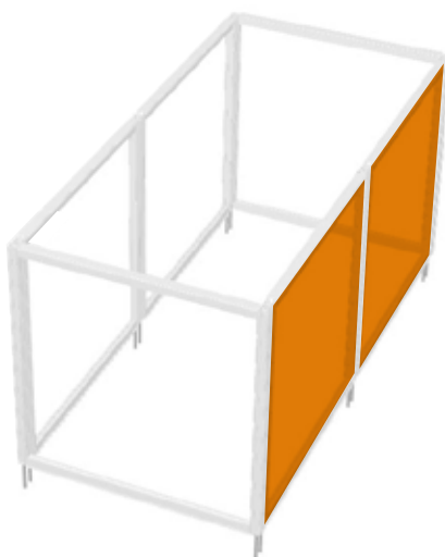
Rechts 1 & 2

HV96x096-N° + HV96x096-N° *HV96x096-E-N° + HV96x096-E-N°