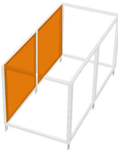
GAUCHE 1 & 2

HV96x096-N° + HV96x096-N° *HV96x096-E-N° + HV96x096-E-N°