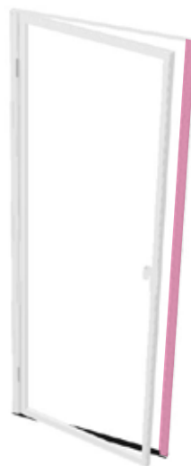
HV01x93- N -R