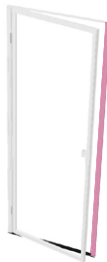
HV01x93- N -D